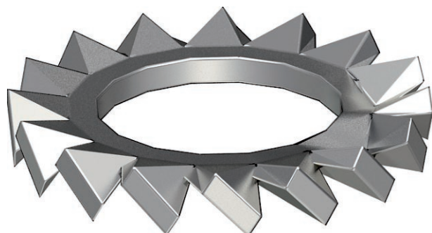
Fächerscheibe nach DIN 6798, Form A.