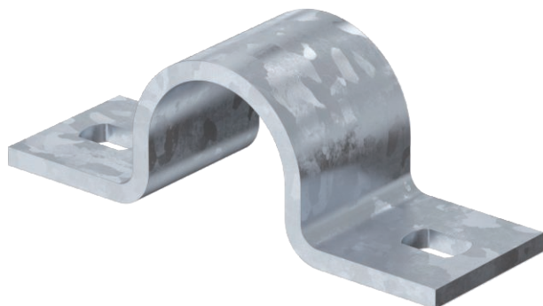
Befestigungsschelle zweilappig 47mm