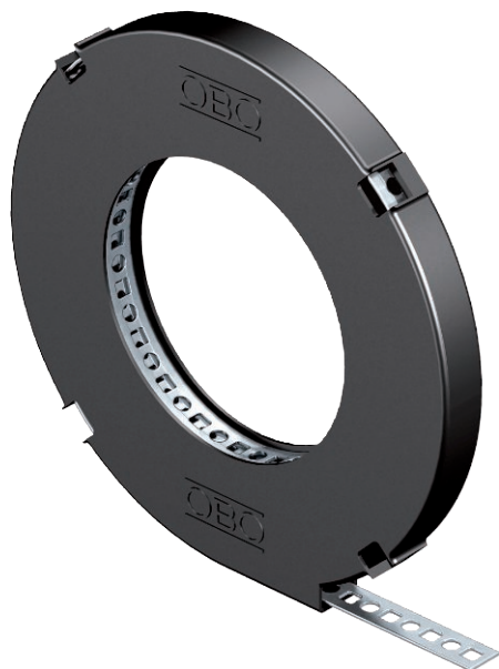
Gelochtes Montageband in praktischer Abrollbox.