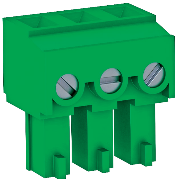
Ersatz-Fernmeldestecker 3-polige Ausführung für VF-Variante