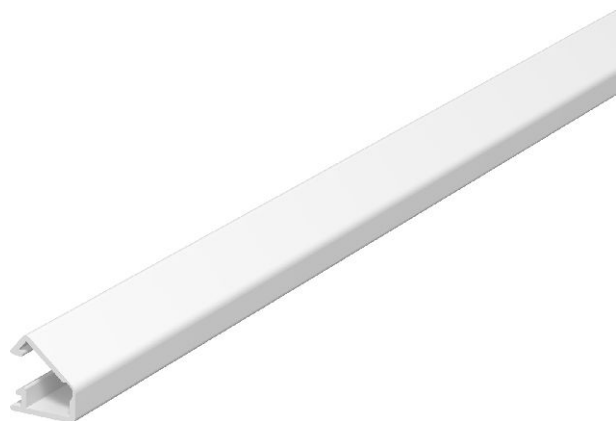
Minikanal mit Klebefolie und Scharnieroberteil.