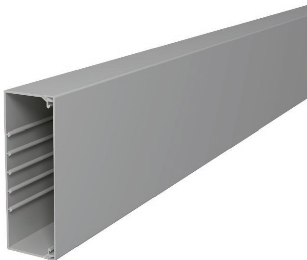
Kanaloberteil und -unterteil mit Bodenlochung.