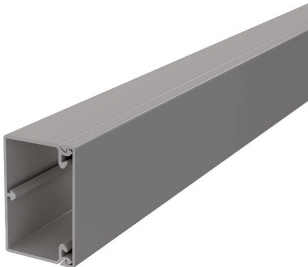
Kanaloberteil und -unterteil mit Bodenlochung.