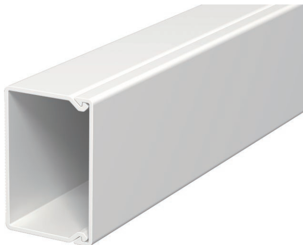
Kanaloberteil und -unterteil mit Bodenlochung.