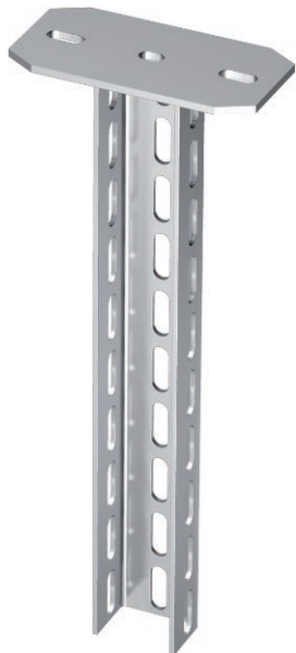
Hängestiel (U-Profil) mit angeschweißter Kopfplatte.