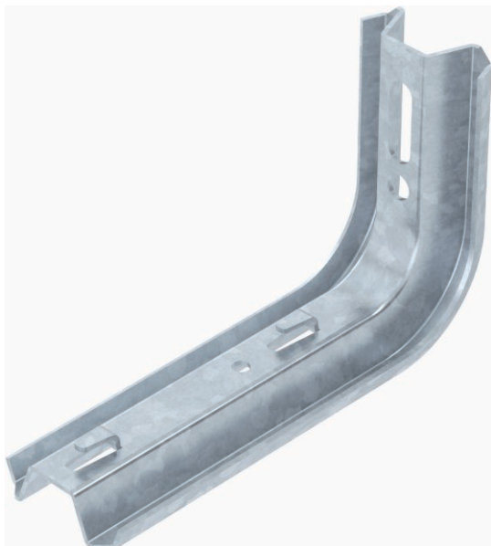
TP-Ausleger mit Klemmlaschen.