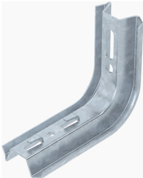
TP-Ausleger mit Klemmlaschen.