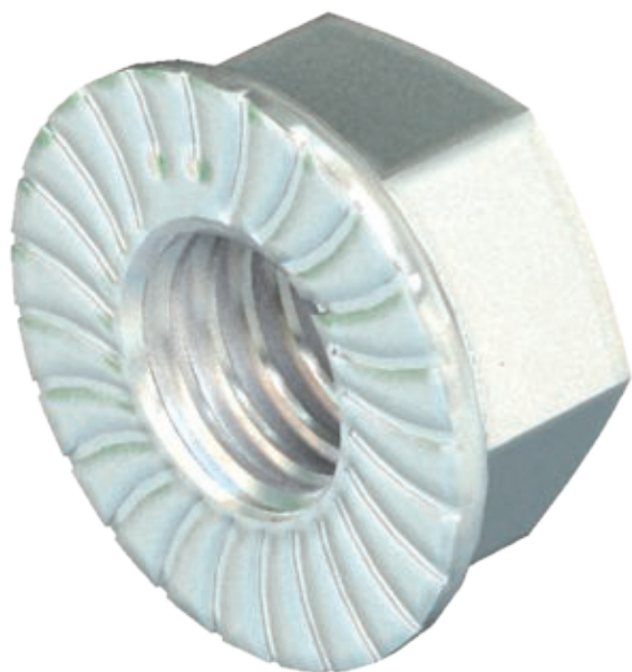
Kombimutter mit angepresster U-Scheibe.