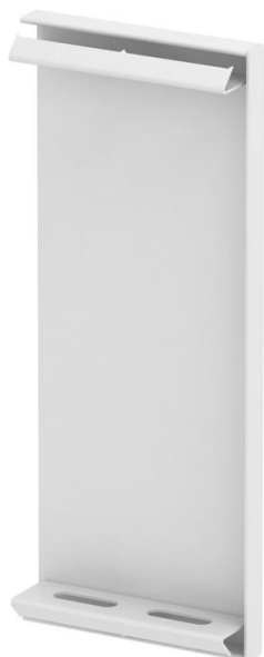
Endstück für GS Geräteeinbaukanal.