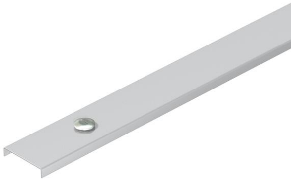
Deckel mit Drehriegel für AZ-Kleinkanal.