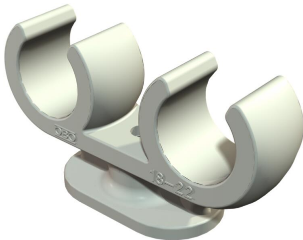
Sockel-Klemmschelle 2 Kabel 18-22mm