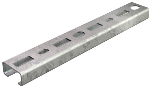
Profilschiene, gelocht, mit 16 mm Schlitzweite.