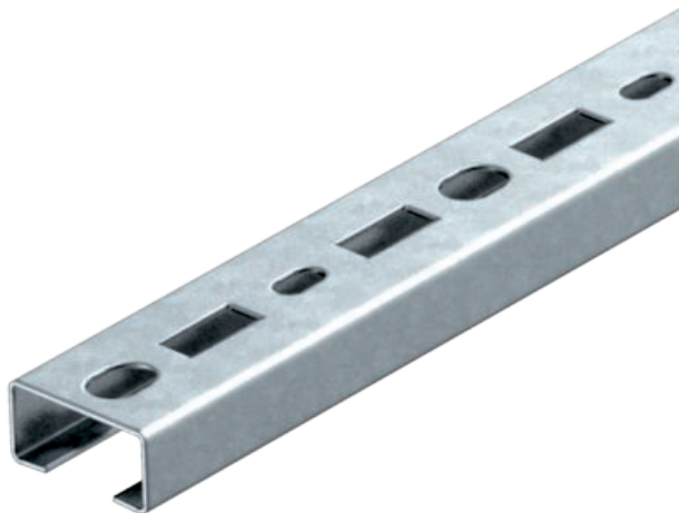
Profilschiene gelocht, Schlitzweite 17mm 150x35x18