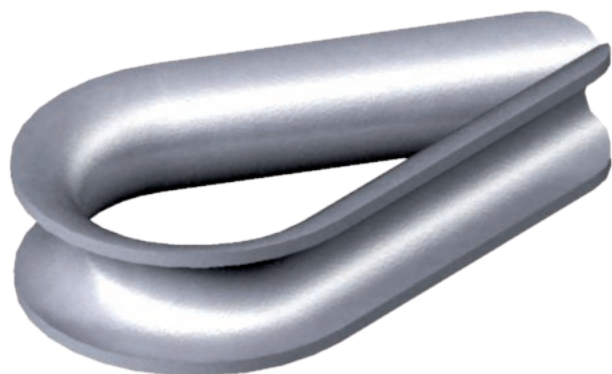
Seilkausche nach DIN 65457.