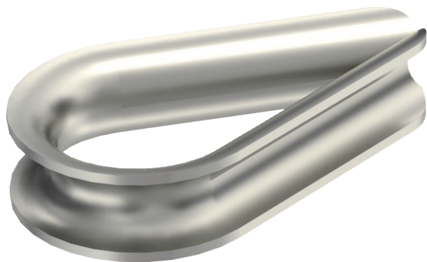
Seilkausche nach DIN 65457.