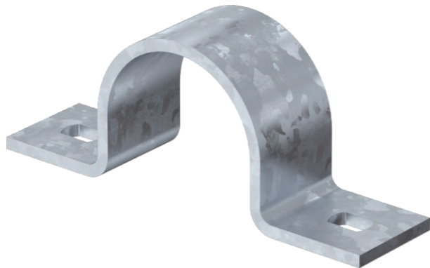
Befestigungsschelle zweilappig 40mm