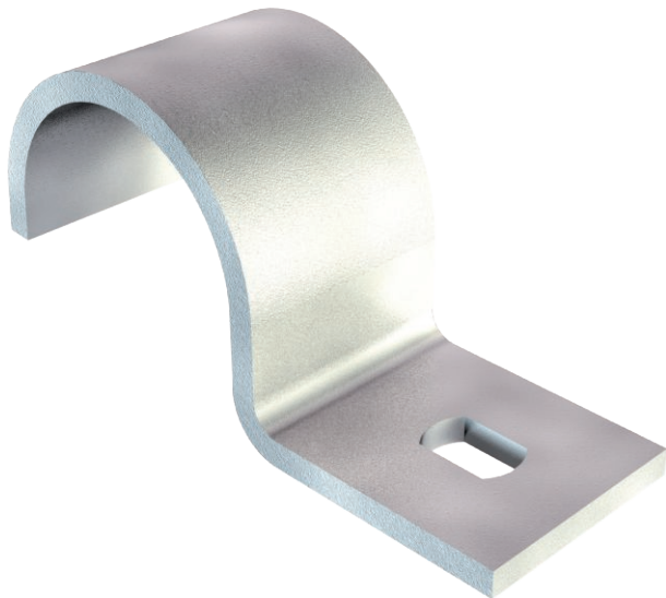
Befestigungsschelle einlappig 14mm