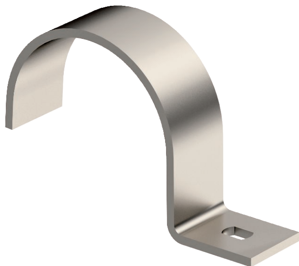
Einlappige Befestigungsschelle für Kabel und Rohre