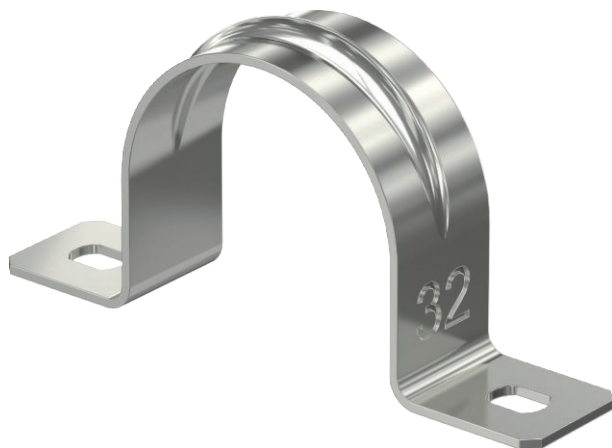
Zweilappige Befestigungsschelle für Kabel und Rohre