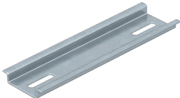
Hutprofilschiene 35 x 7,5 mm nach DIN EN 60715 (früher DIN EN 50022).