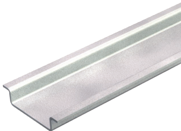
Hutprofilschiene 35 x 7,5 mm nach DIN EN 60715 (früher DIN EN 50022).