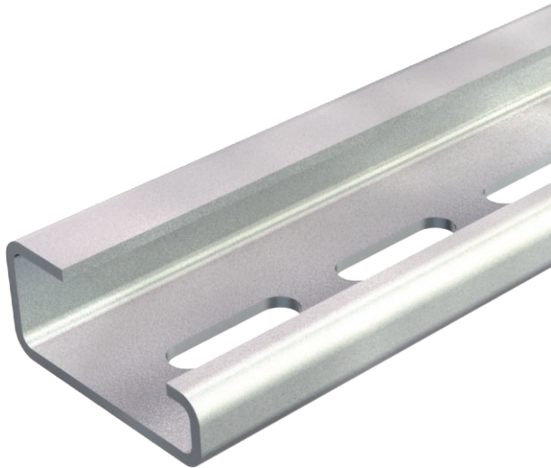
G-Schiene G32 nach DIN EN 50035 (früher DIN 46277 Teil 1) Tragschienebreite 32 mm