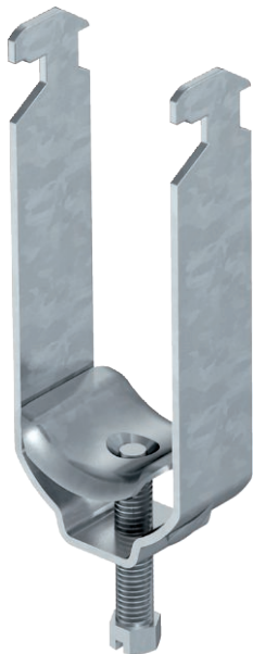
Bügelschelle mit Metalldruckwanne, 2-fach 8-12mm