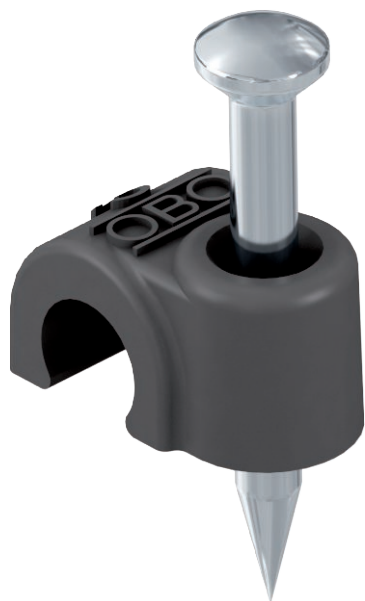
ISO-Nagel Clip, Kurze Bauform