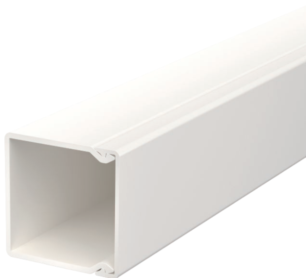
Kanaloberteil und -unterteil mit Bodenlochung.