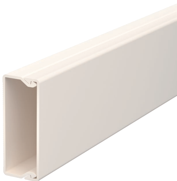
Kanaloberteil und -unterteil mit Bodenlochung.