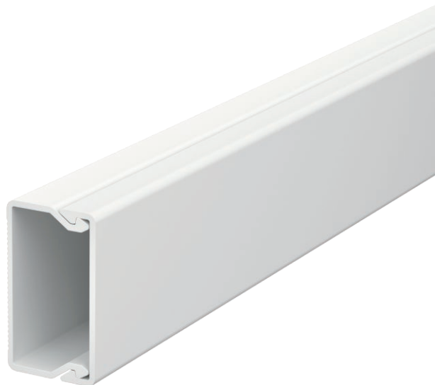
Kanaloberteil und -unterteil mit Bodenlochung.