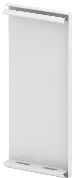
Endstück für GS Geräteeinbaukanal.