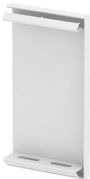
Endstück für GS Geräteeinbaukanal.