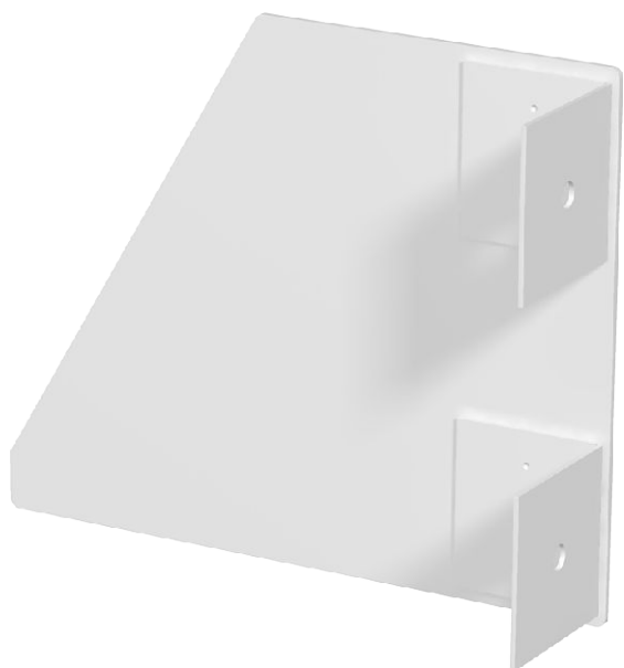
Endstück für Geräteeinbaukanal Typ GEK-S.