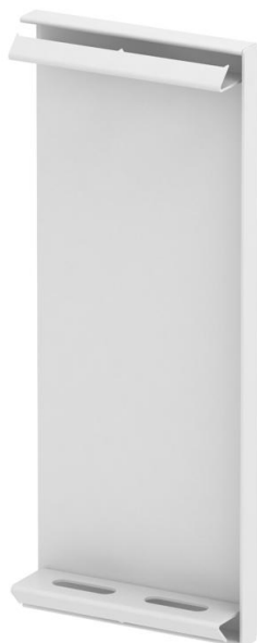
Endstück für GS Geräteeinbaukanal.