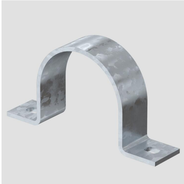
Befestigungsschelle zweilappig 63mm