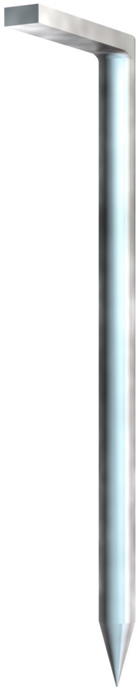
Hakennagel ungehärtet 3x40mm