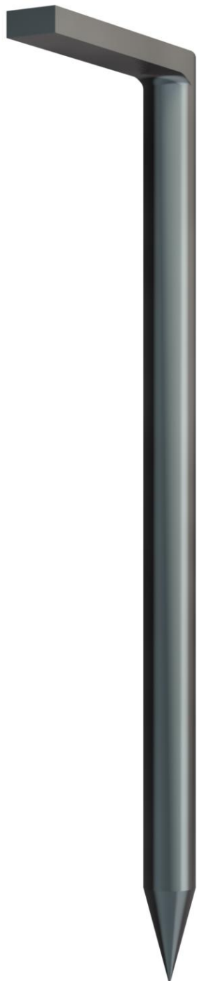
Hakennagel ungehärtet 3x60mm